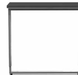
Bügel-Gestell (Typ A) höhenverstellbar von 68-82 cm