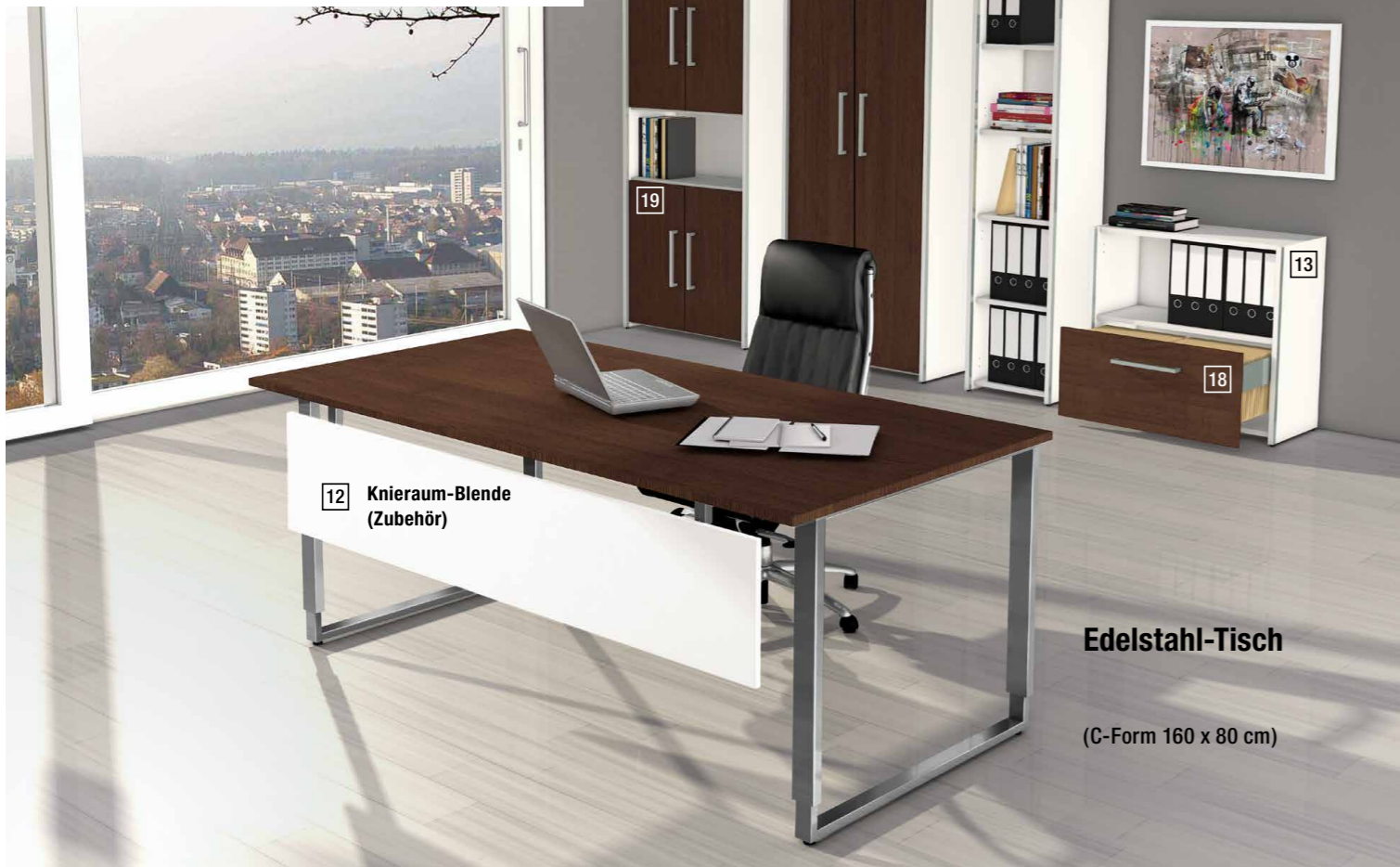
Edelstahl-Tisch (C-Form 160 x 80 cm)