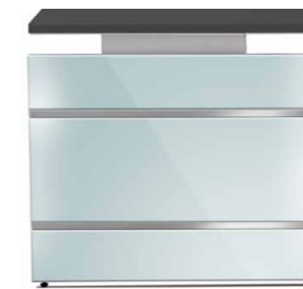
Wangen-Gestell (Typ B) höhenverstellbar von 68-76 cm