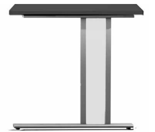
C-Fuß-Gestell (Typ C) feste Höhe